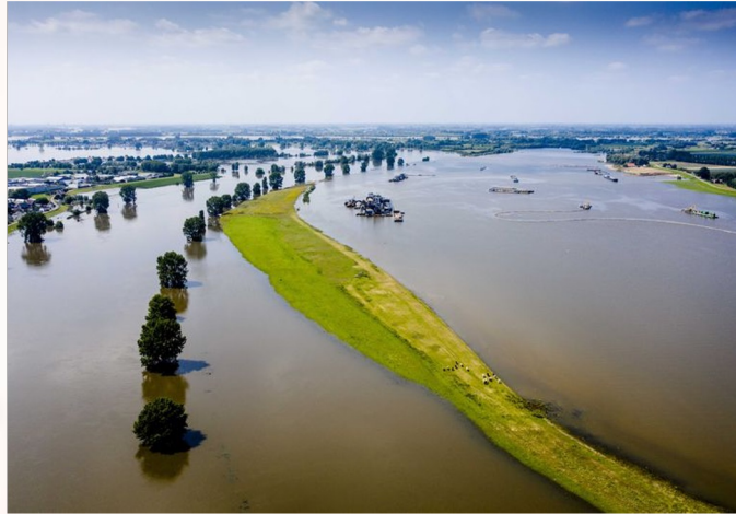
Langs de Maas 2021